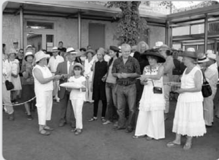
Inauguration des Estivales 2009.

Un grand coup de chapeau à toutes ces personnes qui donnent de leur temps pour que cette fête continue à faire de notre village un point phare des animations.