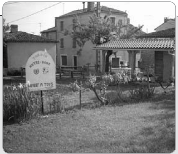
Jardin «Citrus» (Espace Notre-Dame)

L'association Citrus continue de réaliser des ateliers dans les crèches de l'association Chapi-chapeau. Les interventions ont lieu une fois par mois le lundi à Septfonds et ont pour but de sensibiliser les « petits bouts » à la biodiversité et à l'environnement.