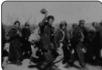
▲ Mars 1939 : les réfugiés Espagnols entre la gare de Borredon et le Camp de Judes.

Comme prévu au calendrier, la nouvelle école maternelle a été mise en service pour la rentrée de septembre, en même temps que les locaux de restauration collective et du centre de loisirs associé à l'école. Venant compléter les installations déjà existantes de l'école élémentaire, c'est un ensemble entièrement restructuré pouvant accueillir près de 12 classes qui vient revitaliser notre centre bourg et garantir également une plus grande sécurité tant à l'intérieur des locaux mais également à l'extérieur par l'adoption d'un nouveau plan de circulation que nous essaierons de développer dans d'autres endroits stratégiques du village.