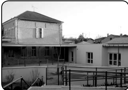
▲ Chantier de la nouvelle école maternelle. Ouverture prévue en septembre 2009.