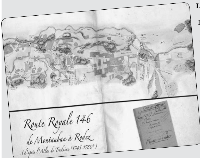
▲ Extrait de l'Atlas de Trudaine réalisé de 1745 à 1780 (page concernant la Traverse de Septfonds visible à la bibliothèque municipale).

Puis c'est un très long tronc commun (104 kilomètres) avec la RN 122 (aujourd'hui D 922 jusqu'à Figeac, puis N 122 de Figeac à Aurillac).