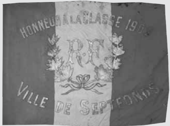
Dimensions : Largeur : 1,70m Hauteur : 1,40m Hampe : 3,40m

Hélas, la professionnalisation des armées en 1996, a mis fin à beaucoup de fêtes de conscrits.