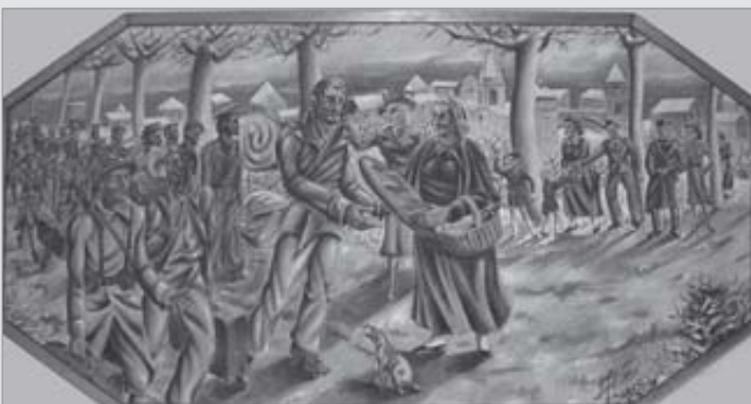
Tableau de l'arrivée des Espagnols de PONTI (1939).

On connaît tous le tableau de l'arrivée des Espagnols exposé à la Mairie de Septfonds. Mais ! n'est ce pas le maire de l'époque, Urbain Solomiac, dissimulé sous le chapeau ? Quelle étrange ressemblance avec ce maire recueilli devant le Monument aux Morts de Septfonds en 1939 ou 1940.