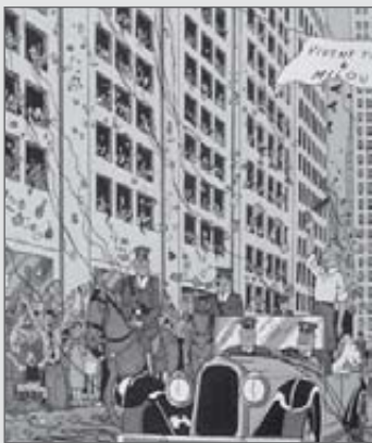
Dessin de Hergé dans Tintin en Amérique