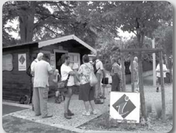
Rendez-vous avant le départ d'une « Matinale »

Merci aux bénévoles pour leur sympathique et enthousiaste dévouement.