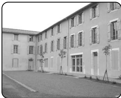
▲ Mai 2008: fin de la 1 ère tranche des logements "DECALUX".

Les élections : en feuillet supplémentaire