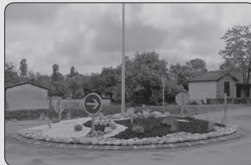
Le tout nouveau rond point du carrefour des Mourgues